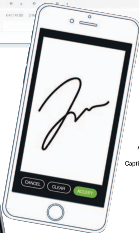
Aplicaciones de NoviCap, Captio, Signaturit y Kantox.