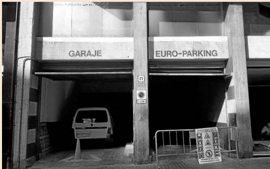
El nuevo supermercado ocupará el local de un antiguo garaje.

Fuentes de Lidl precisaron que el local será gestionado por la compañía en régimen