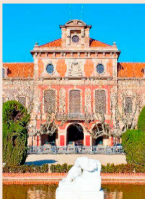
Exterior del Parlament de Catalunya.

Deberán inscribirse al registro consultorías y despachos profesionales, empresas, asociaciones comerciales, sindicatos, colegios profesionales, organizaciones no gubernamentales, fundaciones y todas las instituciones religiosas salvo la Iglesia Católica.