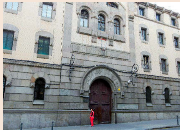
Entrada de la Modelo en la calle Entença, en una imagen de archivo.

una reivindicación histórica de los vecinos de l'Esquerra de l'Eixample. Sin embargo, pese a los reiterados anuncios y promesas, hasta ahora no se